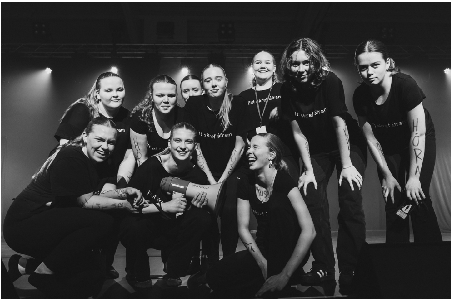
VALLASKÓLI- 2. SÆTI