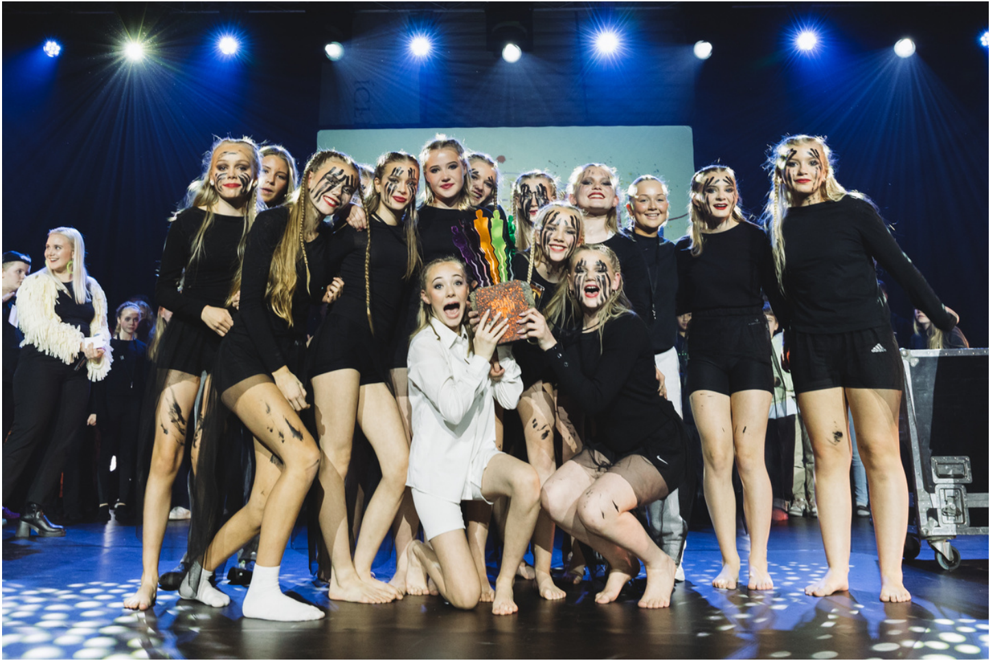
GRUNNSKÓLINN Í HVERAGERÐI - 1. SÆTI