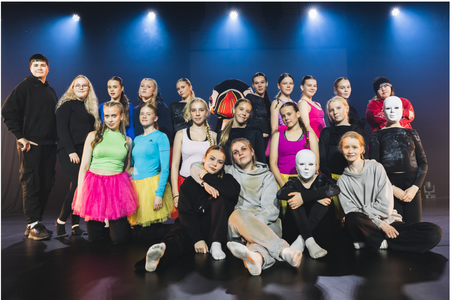
GRUNNSKÓLINN Í VESTMANNEYJUM