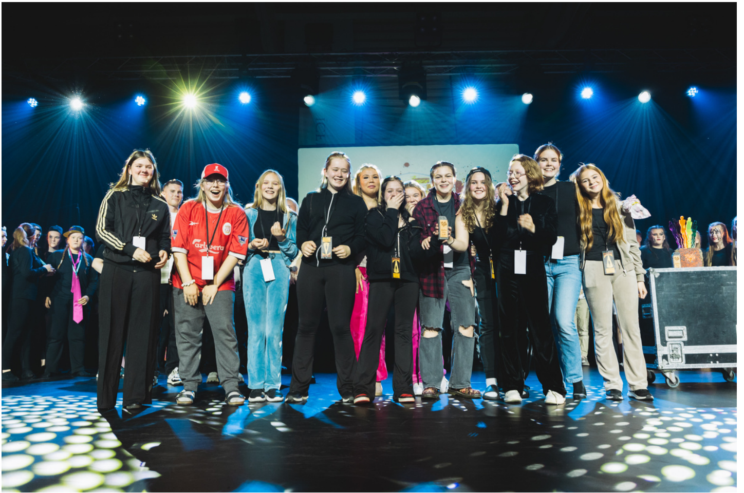
GRUNNSKÓLINN Í ÞORLÁKSHÖFN - 3. SÆTI