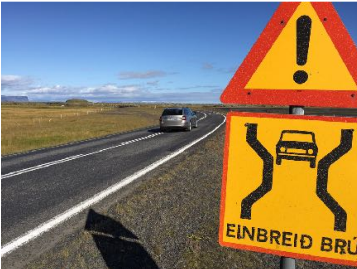
Mynd 8 Einbreið brú við Fossála á Síðu í V-Skaftafellssýslu

Áætlunarflug innanlands er mikilvægur hlekkur í almenningssamgöngum og tryggir aðgengi þeirra sem fjærst búa frá höfuðborgarsvæðinu að nauðsynlegri opinberri þjónustu, sérstaklega heilbrigðiskerfinu.