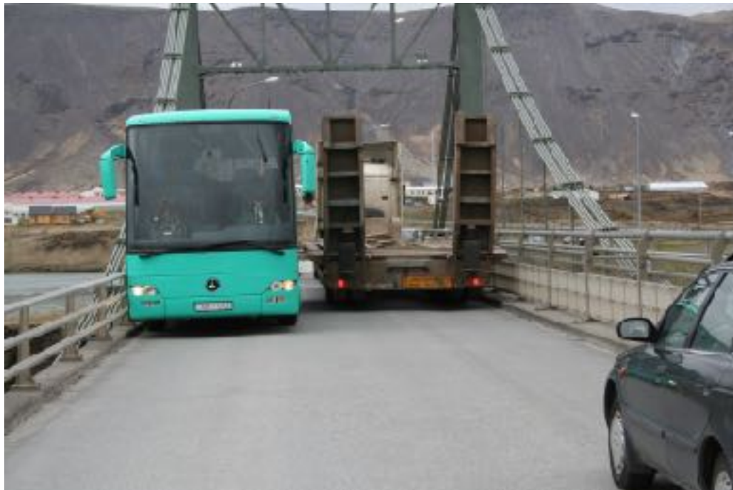
Mynd 2 Þrengsli á Ölfusárbrú.