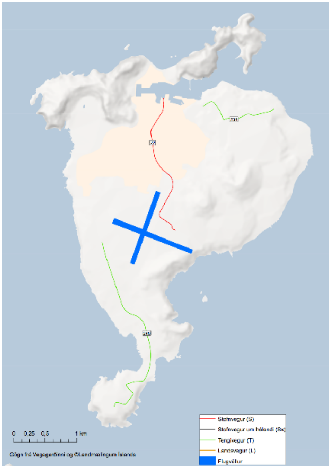
Mynd 6 Myndin sýnir vegi og flugvöll í Vestmannaeyjum.