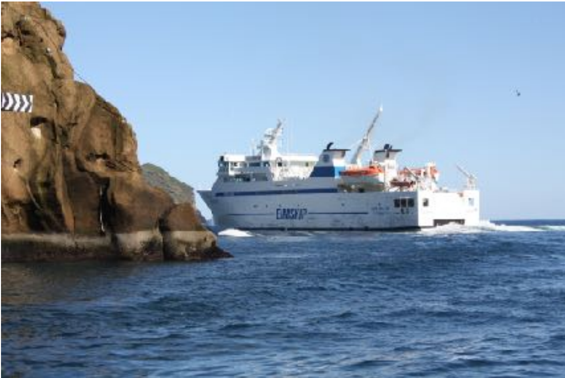
Mynd 9 Herjólfur á “þjóðveginum” til Vestmannaeyja.

Ferjusiglingar til Eyja er ekki skilgreind sem þjóðvegur í dag. Það hefur verið baráttumál Vestmannaeyinga að ferjuleiðin sé skilgreind sem þjóðvegur og fái þjónustu sem slíkur.