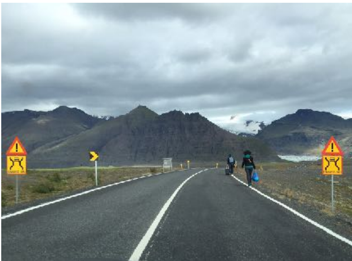
Mynd 7 Fótgangandi ferðalangar á leið yfir einbreiða brú við Skaftafellsá í Örfæum.

355 Reykjavegur - Reykjavegurinn kominn á samgönguáætlun og leggur sveitarstjórn Bláskógabyggðar mikla áherslu á að framkvæmdin fari í útboð í haust.