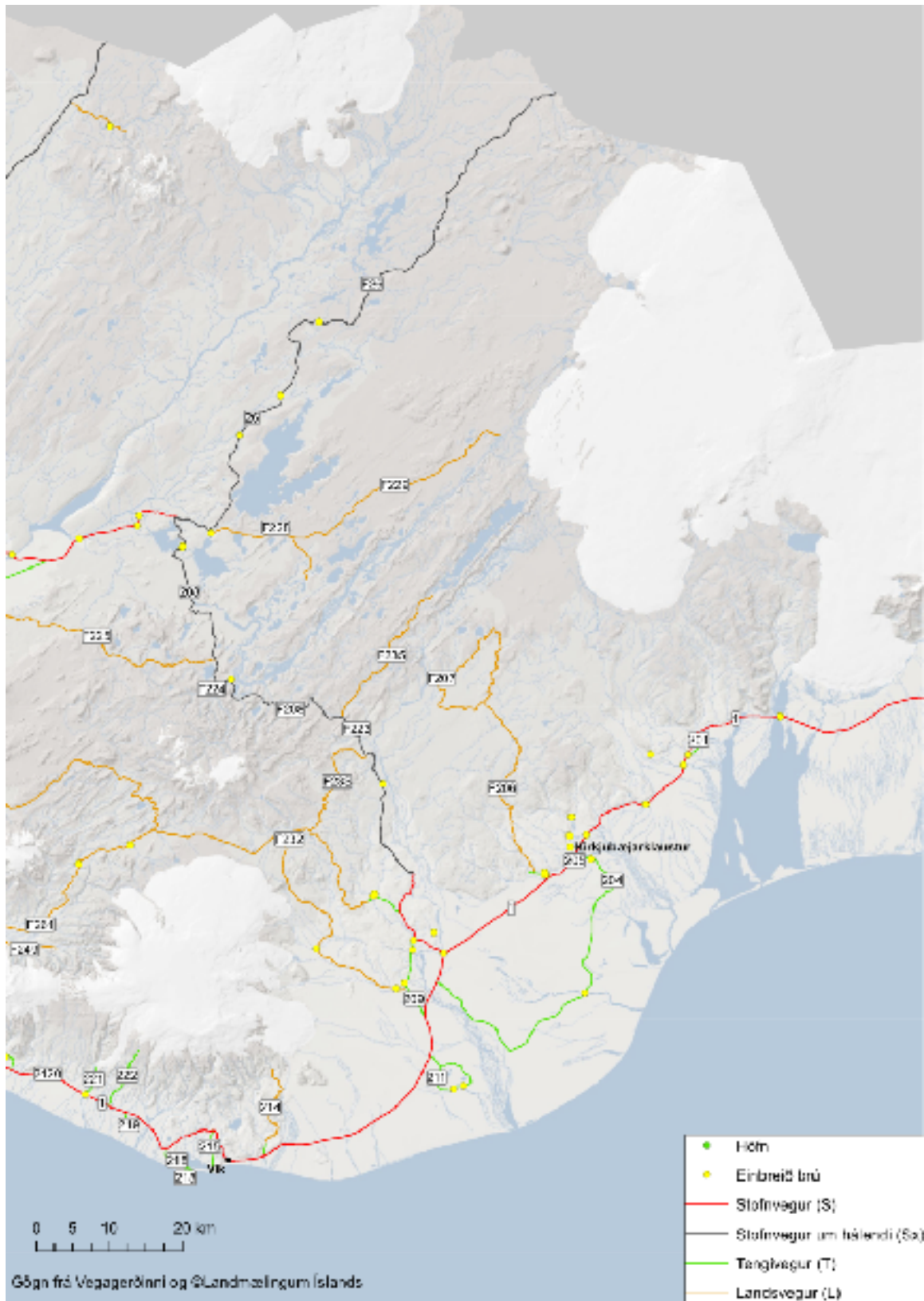
Mynd 4 Myndin sýnir vegi frá Skógasandi að Skeiðarársandi auk fjallvega á miðsvæði Suðurlands.